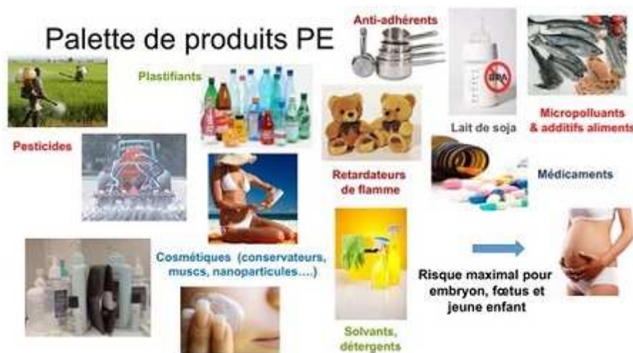
La « palette » des produits qui nous exposent aux P.E. ?

En résumé, au fil de cet inventaire à la 'Prévert' de substances dont les expérimentations 'in vitro' ou sur l'animal et études épidémiologiques chez l'homme ont révélé les pouvoirs sur le système endocrinien, se dévoilent les multiples facettes de leurs effets :