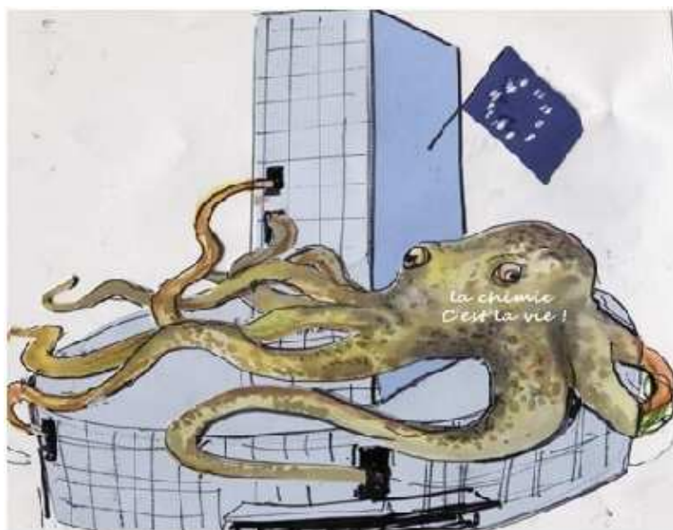
Les lobbies à l'œuvre à Bruxelles

À la suite des multiples alertes, mettant en cause des substances très diverses, mentionnées dans le raccourci historique du point A pour les années 80-90, une prise de conscience européenne de ces dangers a amené la Commission à annoncer dès l'an 2000 la préparation de critères définissant clairement les PE et d'une liste de substances à évaluer en priorité pour leur activité PE (effets constatés et exposition humaine importante par usage personnel ou domestique, ou forte persistance environnementale), à partir de 564 substances candidates proposées à cette époque. Simultanément le Parlement Européen prenait une résolution pour l'application aux PE du principe de précaution, et le recensement des substances demandant une action immédiate.