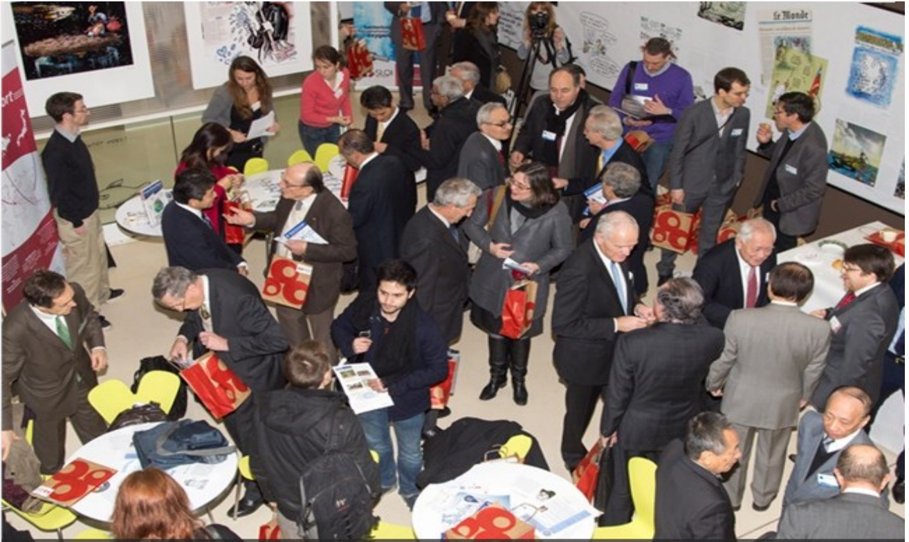
Pavillon de l'eau de la Ville de Paris - 1 ère Journée franco-asiatique de l'eau 2014

• Le 4 février 2014, l'Académie de l'Eau, en partenariat avec la Société franco-japonaise SLQI Systems, a organisé, avec l'appui de la fondation franco-japonaise Sasakawa, une première Journée franco-asiatique sur le thème de l'eau et ses éco-traitements, au Pavillon de l'Eau de la Ville de Paris. Une seconde Journée franco-asiatique "Regards croisés sur l'eau et l'assainissement" a été programmée le 10 février 2015 au même endroit.