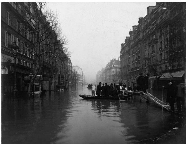
Paris inondé, la crue de la Seine, janvier à mars 1910

Le projet intitulé « Les territoires de l'eau et la gestion métropolitaine du risque d'inondation : du bassin amont de la Seine au Grand Paris » (TERIME), piloté par le Laboratoire Eau, Environnement et Structures Urbaines (LEESU) de l'École Ponts Paris Tech, consiste à étudier le processus de territorialisation du risque d'inondation en considérant deux types de phénomènes, le risque fluvial et le risque pluvial. Cette recherche vise à mettre en évidence les différences, les points communs et les possibilités d'enrichissement réciproques. Il s'agit de contribuer à « alimenter » l'idée de gestion intégrée du risque d'inondation à une échelle métropolitaine. Cette recherche, effectuée en partenariat avec l'Académie de l'Eau a donné lieu à deux ateliers de travail, les 17 janvier et 30 octobre 2012 au siège de l'EPTB Seine-Grands Lacs, avec la participation du Conseil Général du Val de Marne et de l'Agence de l'eau Seine Normandie.